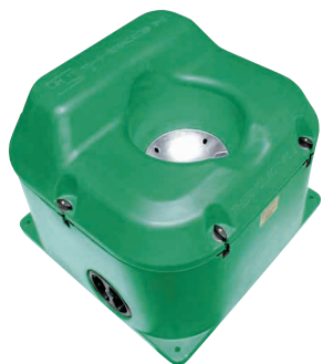
Taille 64 × 66 cm