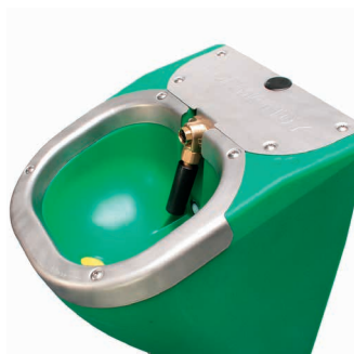
robinet à tube