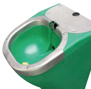
robinet à flotteur