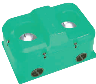
Taille 99 × 66 cm