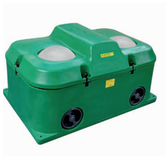
Taille 92 × 54 cm