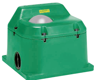
Taille 64 × 54 cm